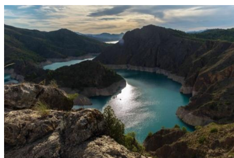
Vista sobre el embalse